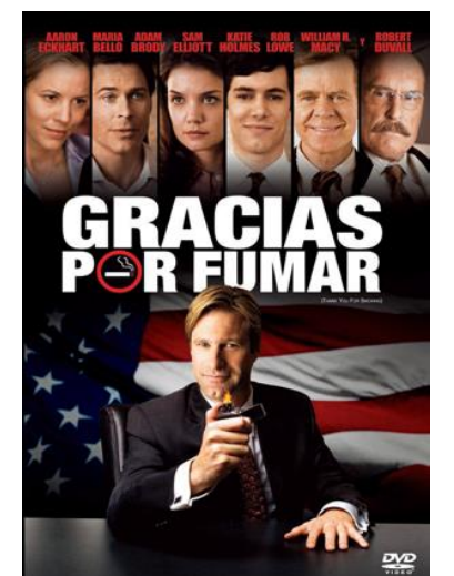
Gracias por fumar