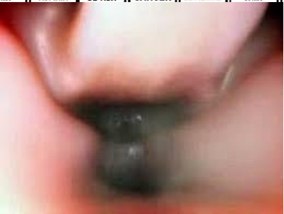
Como causa daños el cigarrillo