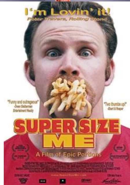
Super size me