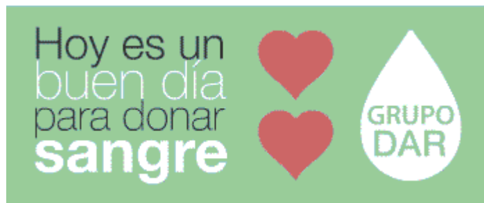
DAR | Donantes altruistas repetitivos del Hospital Alemán