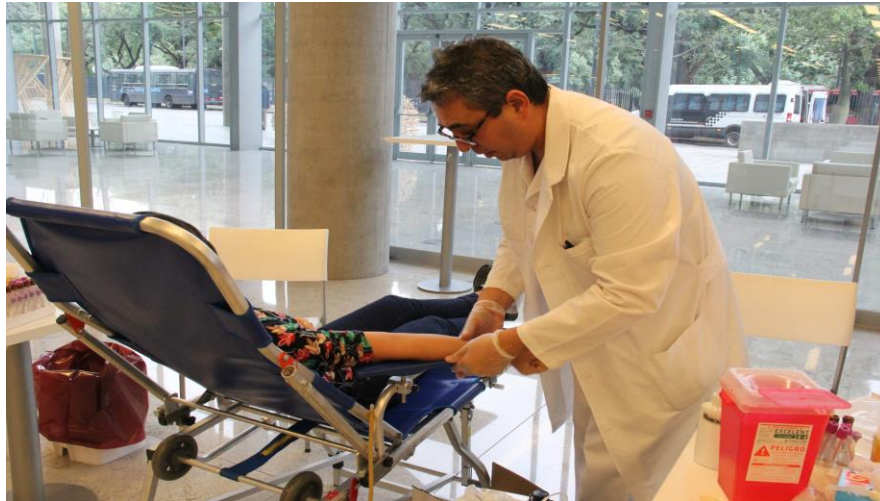
Campañas por el día mundial del donante de sangre. Buenos Aires Ciudad