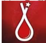
Centro Nacional de la Transfusión Sanguínea