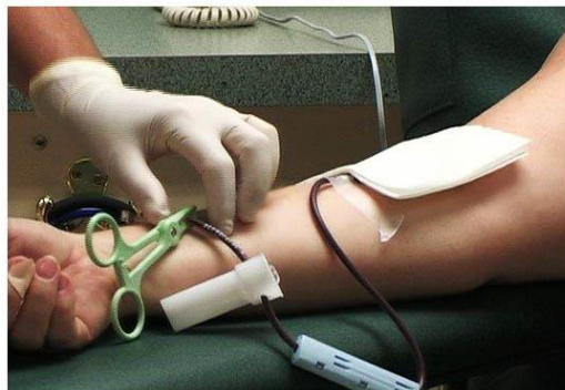
La Plata. Colecta de sangre