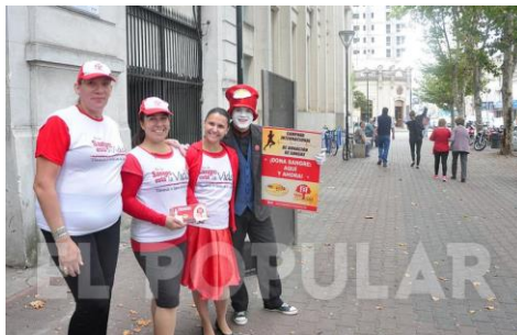
Olavarría. Colecta externa por el Día Mundial del Donante de Sangre