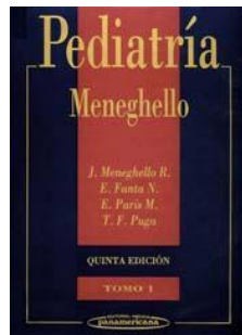
Pediatria. Meneghello, 1997